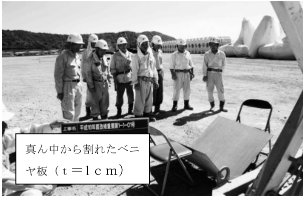
真ん中から割れたベニヤ板 (t=1cm)