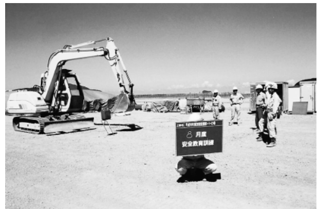
写真-2 安全教育訓練