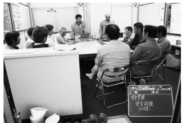
写真-1 一般的な安全教育・訓練

一見分かったような、分からないような内容であるが、半日で(1)～(6)まで出来る訳もなく、頭をひねりつつ、計画を立てるのだが、どうしても(1)