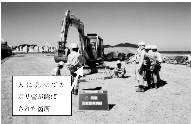
写真-3 安全教育訓練

とにかく人間は、何かに（作業）集中すると、周囲の確認がおろそかに成りがちである。（周りがみえなくなる。） バックホウはキャビンがついておりブーム側はかなり視界が悪い。 0.3m 3 バックホウ（ヤードの整地に使用）をゆっくり回転させ、人に見立てたポリ管に接触させてその衝撃の度合いを実験してみました。