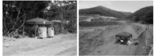
写真-9 簡易式休憩所