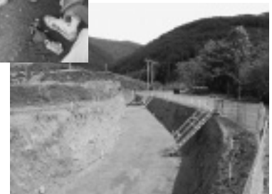
写真-11 転落防止ネット ・昇降設備