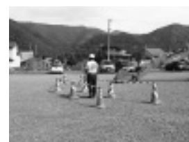
写真-6 作業半径の確認