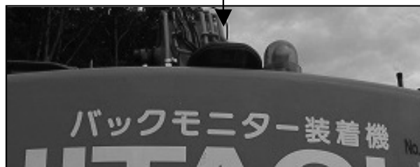
写真-4 バックホウ バックモニタ