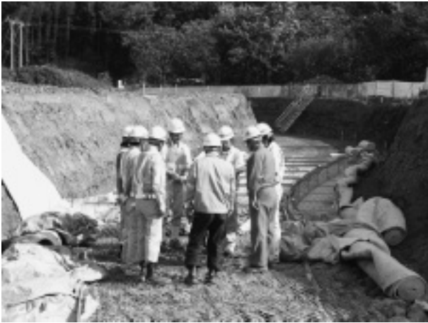
写真-7 現地 KY 状況