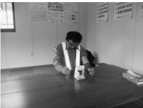
写真-8 血圧計による体調管理

掘削箇所は転落防止ネットを設置し、転落を防止すると共に、作業エリアの区別を行い、昇降設備を一定間隔で設置した。