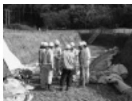
写真-5 重機死角の確認