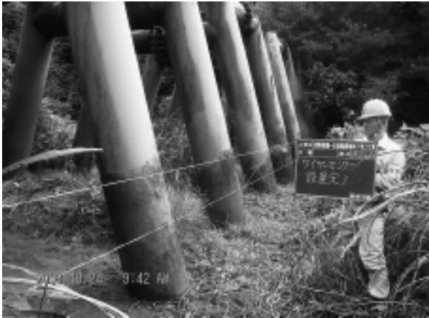
写真-2 ワイヤーセンサー設置