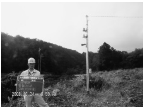
写真-3 回転灯 (赤・黄色) 及びサイレン

3) ライブカメラの設置 河川上流の状況を確認できるようにライブカメラを設置することで、土石流前兆現象を逸早く把握し工事従事者へ避難指示を行える環境を整備しました。