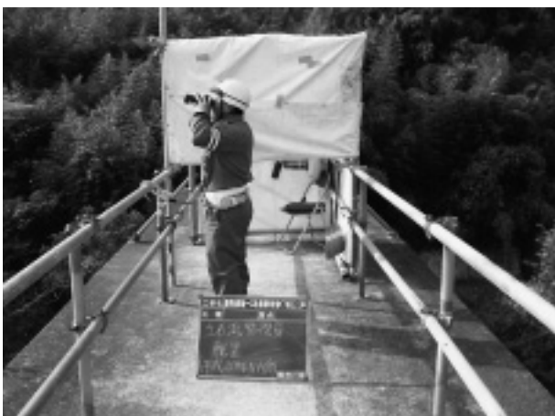
写真-4 土石流監視員

3) ライブカメラの設置 河川上流の状況を確認できるようにライブカメラを設置することで、土石流前兆現象を逸早く把握し工事従事者へ避難指示を行える環境を整備しました。