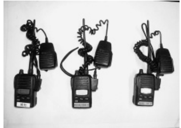
写真-5 無線機 3台