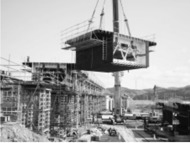
写真-7 地組桁の架設状況