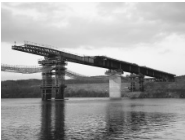
写真-5 桁送出し状況

よって、送出し時反力のベント内の移動までも考慮し、中間ベントをより安全に強固な構造とすることにより支点沈下もなく送出し架設を完了することができたと考える。