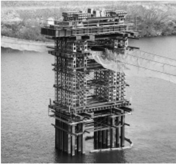
写真-4 中間ベント設備