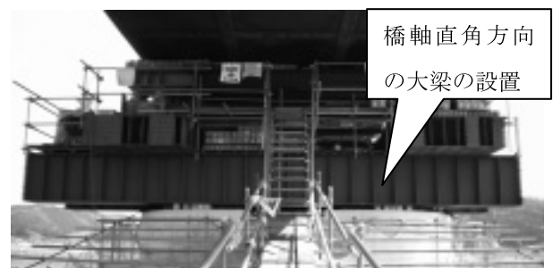
写真-3 本工事での送出し設備