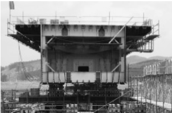
写真-1 本工事の桁断面

本橋は東北地方有数の北上川を渡る全長520mの鋼床版箱桁橋である。箱断面の大きさは腹板間隔6.9m、桁高最大4.8mの非常に大きな1箱桁断面であり、写真-1に示されるように側床版を含め8分割の断面で構成されている。