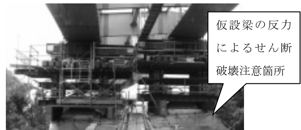
写真-2 一般的な送出し架設時の設備例

送出し完了後には桁を2.5m降下し、支承に桁をセットする必要があるため、桁降下可能なベントの組合せとした。