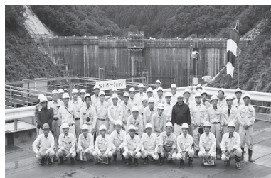
H26現地研修「金出地ダム」