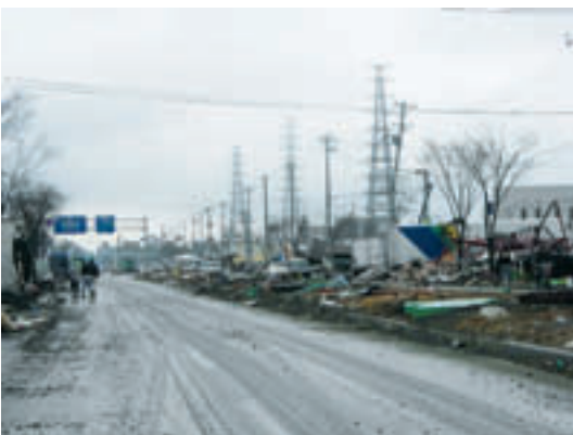
県道仙台塩釜線（産業道路）