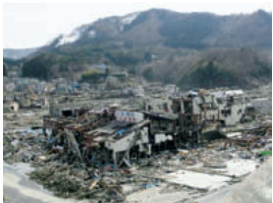
牡鹿郡女川町の建物群