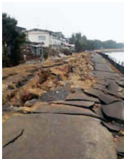
多賀城市砂押川沿い