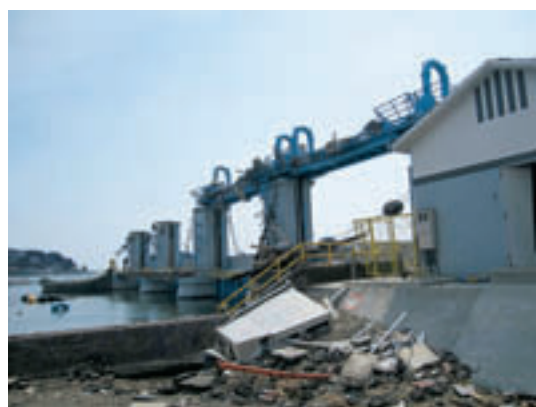
本吉郡南三陸町の防潮水門