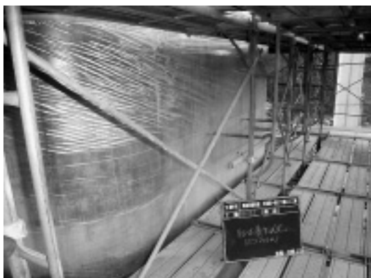
写真-5 ビニールシート養生（脱型後）

シート内は約5℃程度高く効果を確認できた。脱枠後はビニールシート（ t=0.2\text{mm} ）を躯体に巻きつけ（写真-5）、保温効果と急激な乾燥を防ぐ効果を期待した。