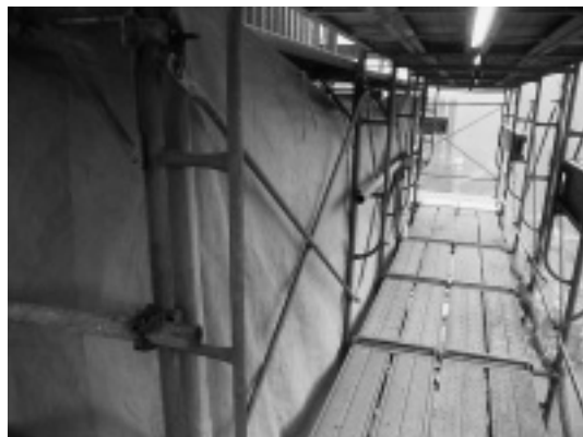
写真－4 ブルーシート養生