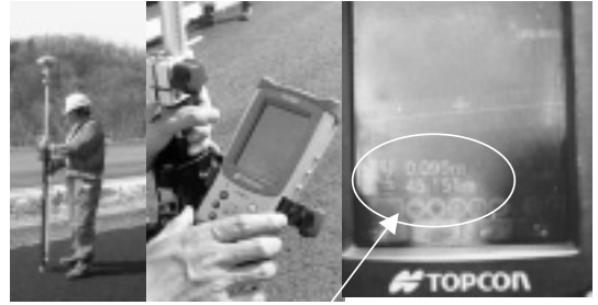
基準高45.151mで設計より9.5cm低い