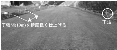
写真-1 丁張間の仕上げ

こととなる。そのため、オペレーターが未熟な場合、丁張間で不陸を生じさせることがある。