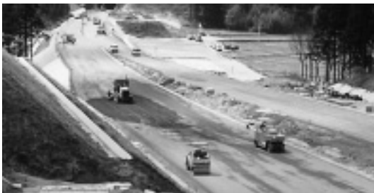
写真-2 上層路盤施工状況

検測員の持つ検測器（写真-4）は、位置情報・基準高情報及び設計高との差等がモニターで直接確認できるもので、三次元データによりどの場所（例:U型側溝等）でも検測可能である。