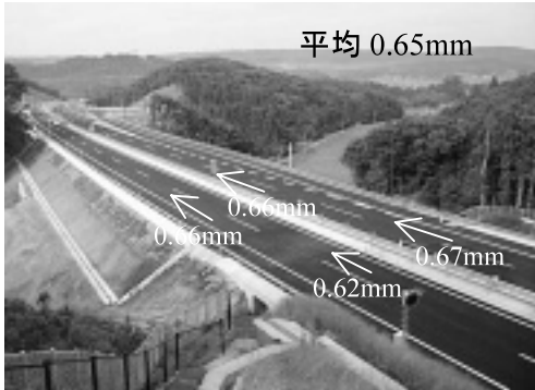
写真-5 表層平坦性測定結果

した結果、0.65mmが得られ、技術提案値を高度な水準で満足することができた(写真-5)。